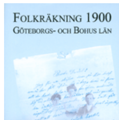
Folkräkningen 1900 - snart även rikstäckande på CD

Mer information på http://www.svar.ra.se/