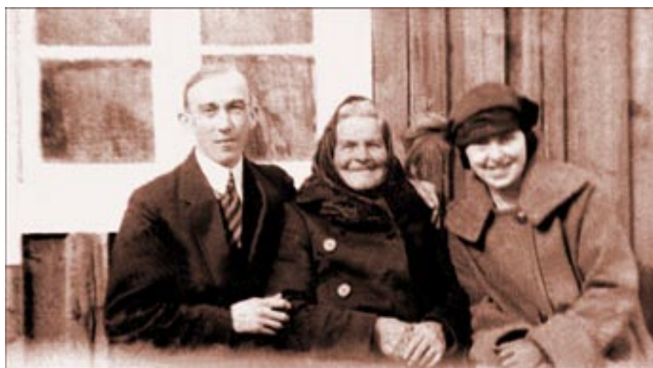
Bild 7: Den färdiga bilden, som kan användas för att göra en fotokopia hos ett fotolabb. Men kopian bör göras på ett bra (långvarigt beständigt) fotopapper! Jämfört med originalbilden är den nya bilden mycket bättre...