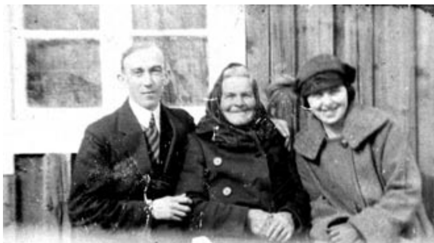
Bild 5: Bildens tonomfång och kontrast har förbättrat bilden. Men alla fläckar och damm måste retuscheras bort i nästa steg...

punkter. Dra därefter, om så behövs, den grå triangeln i mitten mot vänster eller höger för att göra bilden mörkare eller ljusare (det s.k. gammavärdet). Nu har den bleka bilden förvandlats till en bild med normalt tonomfång, från svart till vitt. Klicka sedan på OK (bild 5).