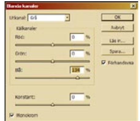
Bild 3: Genom funktionen Blanda kanaler kan den bästa kanalen väljas, i detta fallet ger blåkanalen bäst resultat.

Nästa steg är att gå till Läge/Justeringar/Blanda kanaler, där en lämplig