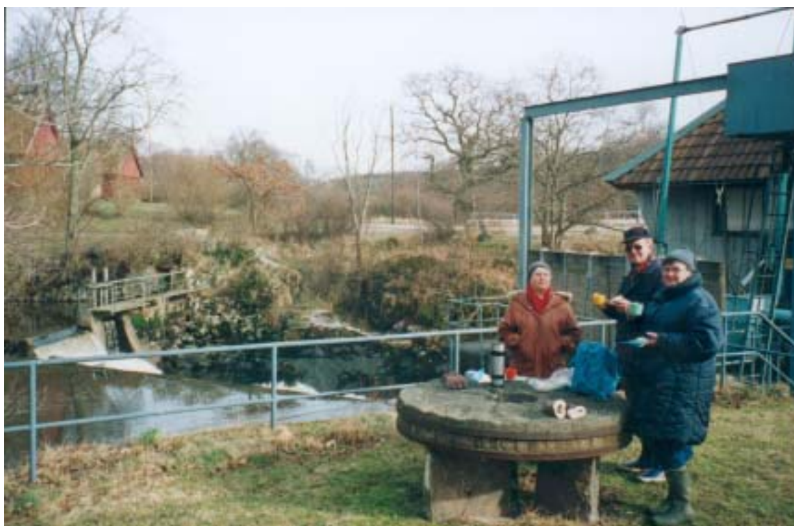
Dammen vid Hallarna idag. Kvarnstenen minner om den gamla kvarnen. Kraftverket skymtar till höger och är fortfarande i bruk.