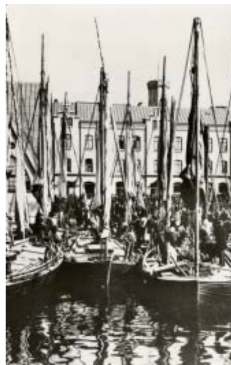
Göteborg. Fiskekuttrar i kanalen utanför Feskekyrkan på 1880-talet.

I slutet av 1894 erhöll jag som gåva en ny, särdeles fin cykel, av min fosterfar. Den var stor och tung, en s.k. landsvägsmaskin av märket "Atalanta". Den kostade hela 360 kronor och det var ju mycket pengar på den tiden. Det fanns inte många cyklar i bruk då och jag var inte lite stolt då jag var ute på cykel-